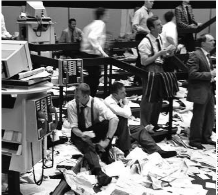
Le système de régulation ne fonctionne plus aux États-Unis, empêtrés dans la crise des subprimes . Le secrétaire au Trésor Henri Paulson veut le réformer.

D'autre part, une fois de plus, c'est le « retour du balancier » avec une importance accrue accordée aux questions de régulation, bien que ce ne soit pas un défaut de régulation qui ait déclenché la crise mais plutôt le fait que le système de régulation américain ait été contourné par les banques d'investissement et les courtiers. Pour circonscrire le feu, avons-nous besoin d'une législation à chaud avec le risque de déclencher des réactions précipitées pouvant se révéler inappropriées ou disproportionnées ? Ne faut-il pas privilégier un agenda de régulation ? Si oui, quelle pourrait en être la hiérarchie ? Au niveau européen, la régulation s'appuie sur les travaux du « Comité des Sages » sur la régulation des marchés européens de valeurs mobilières que présidait Alexandre Lamfalussy. Ce Comité a retenu une approche basée sur quatre niveaux, visant une coopération renforcée, plus de rapidité dans l'élaboration et d'efficacité dans la mise en œuvre de la législation européenne mais, déjà, Alexandre Lamfalussy s'interrogeait sur le besoin d'un régulateur européen. On bute sur la subsidiarité, chaque État tenant à rester maître de sa régulation bancaire et les modèles d'organisation n'offrant pas de cohérence entre eux.