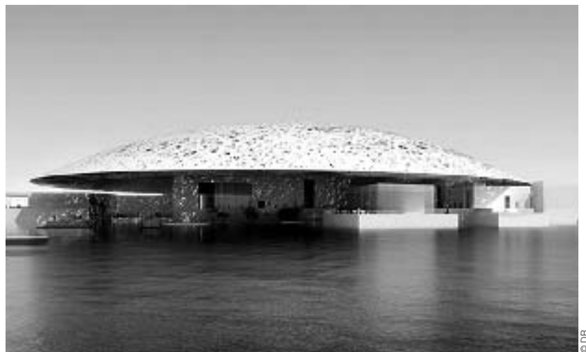
Le projet de Jean Nouvel sur l'île de Saadiyat fait partie des cinq grands projets culturels prévus pour 2015, dont le plus grand « Guggenheim » du monde.